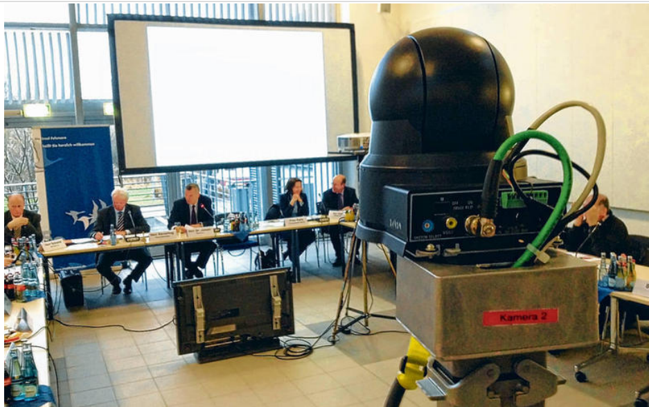
Im Dialogforum wurden die Kameras zur Live-Übertragung im Internet erstmals ferngesteuert.